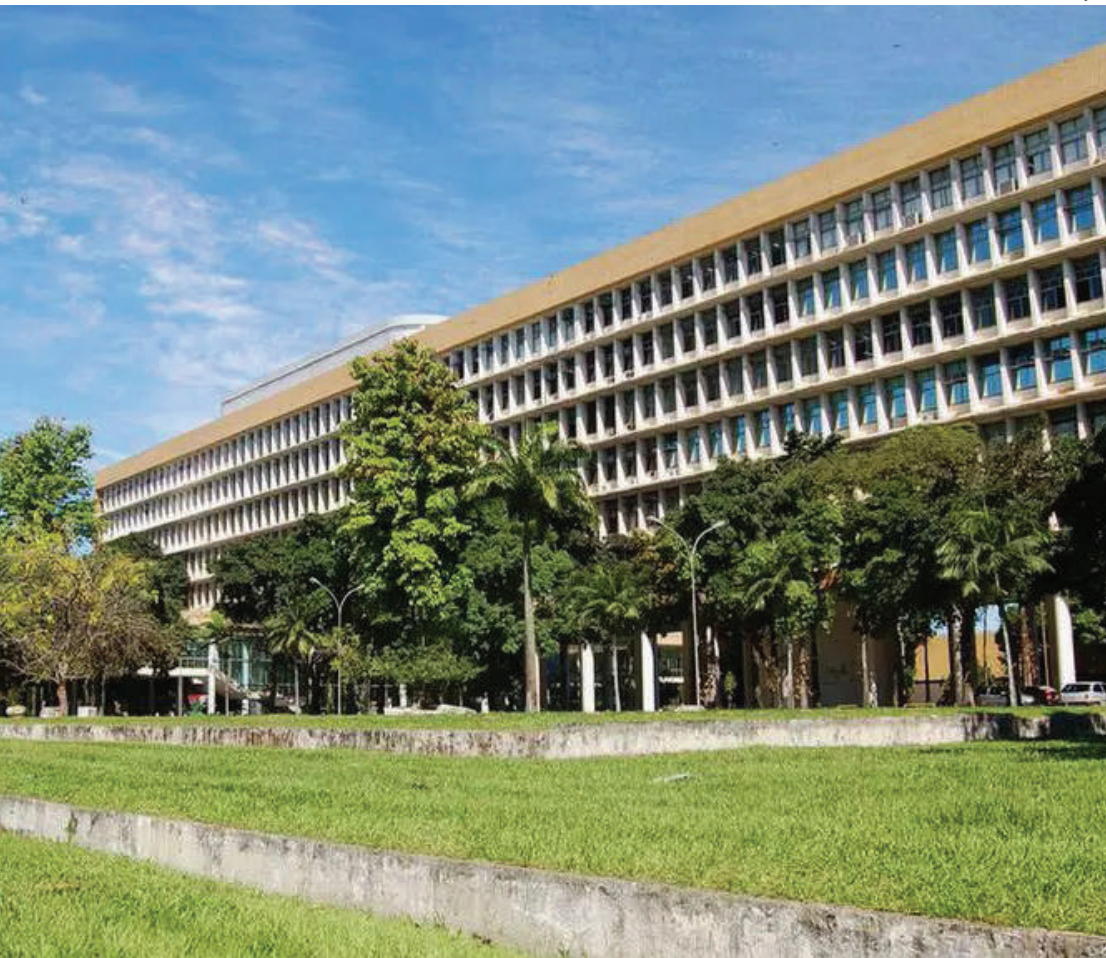
A UFRJ é considerada a segunda melhor universidade do Brasil e a terceira melhor universidade da América Latina