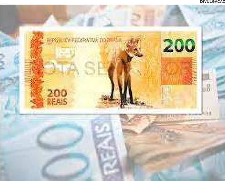
A nota de R$ 200,00 poderá circular com velocidade durante as eleições

A divisão de verbas do fundo eleitoral que vem provocando brigas acirradas nos partidos, leva os partidos a apostar em