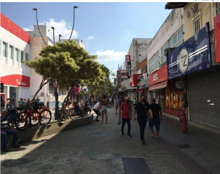
O setor de roupas e calçados vem apresentando uma recuperação expressiva, trazendo otimismo aos comerciantes