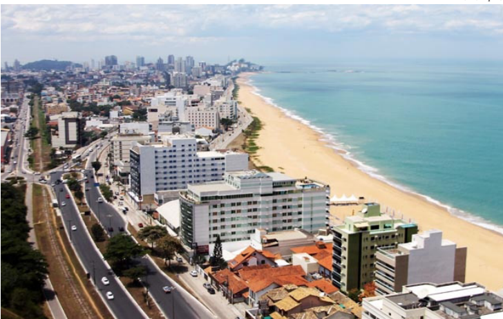
A hotelaria foi um dos segmentos mais atingidos nos últimos meses frente à pandemia do COVID-19