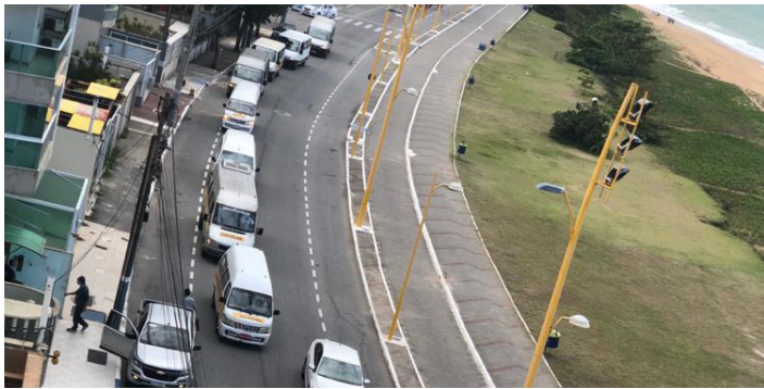
A carreata aconteceu nesta sexta-feira (28)

Aconteceu nesta sexta-feira (28), em Macaé, a carreata dos motoristas de vans escolares particulares e prestadoras de serviços para a prefeitura. A ação teve por objetivo reivindicar seus direitos, solicitando um auxílio emergencial ao poder público, por estarem passando por inúmeras dificuldades financeiras frente à pandemia do novo coronavírus. PÁG. 7