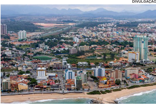
Macaé aparece com o número ultrapassando a casa dos 250 mil habitantes

O IBGE não faz projeções de população para o nível geográfico municipal. As Projeções da População para o Brasil e as Unidades da Federação são prospectivas, estimadas por métodos demográficos, com horizonte atual definido até 2060. As populações projetadas são disponibilizadas por sexo e grupos de idade, possibilitando análises acerca da evolução do tamanho e da estrutura etária da população. Para informações mais detalhadas sobre o tema, consultar Projeções da População