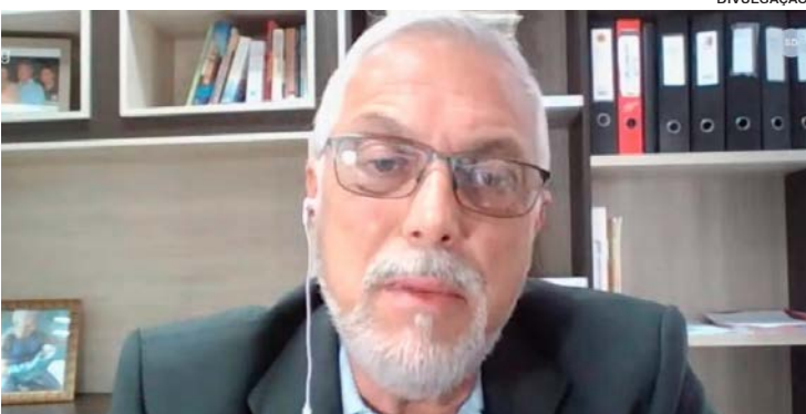
A live “Seu bairro em destaque” está sendo realizada toda segunda-feira, às 19 horas, pelo Facebook Maxwell Vaz e também pelo canal no You Tube do parlamentar

Com a missão de fazer diagnósticos precisos e importantes para melhoria dos bairros, Maxwell oportunizou a todos a discussão, inclusive ao público, que participou com questionamentos contundentes que esquentaram o debate.