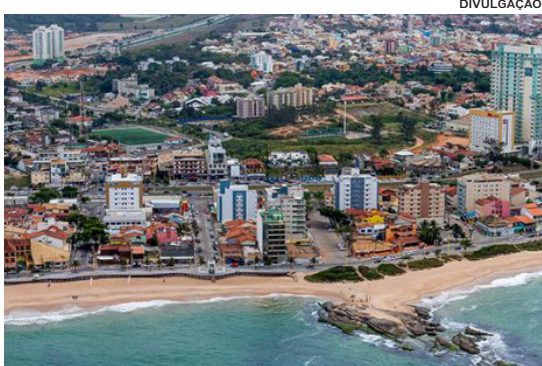
Macaé aparece com o número ultrapassando a casa dos 250 mil habitantes

O Instituto fornece estimativas do total da população dos Municípios e das Unidades da Federação brasileiras PÁG. 6