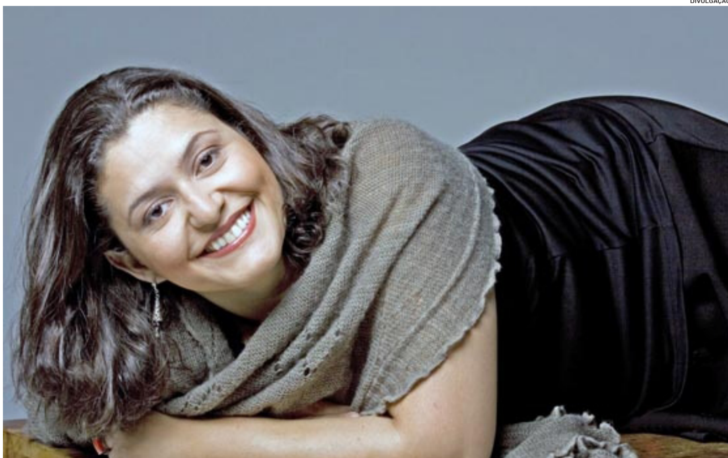
As aulas são gratuitas e acontecem das 16h às 17h30 pelo canal Youtube.