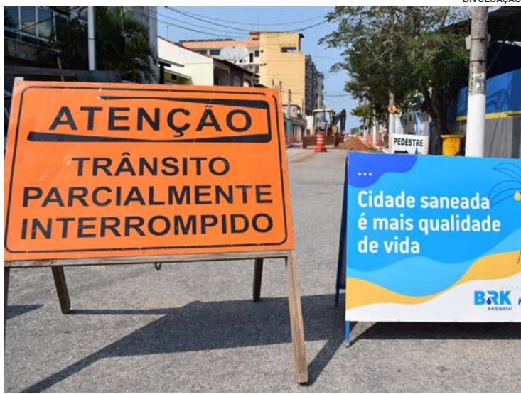
Os trabalhos que fazem parte do planejamento para o Subsistema Centro vão exigir interdições parciais, além de restrições de estacionamento

Cronograma - As obras de saneamento são realizadas por trechos das vias e as equipes não necessariamente atuam simultaneamente em todas as ruas. Esta programação é revisada semanalmente e pode sofrer alterações por