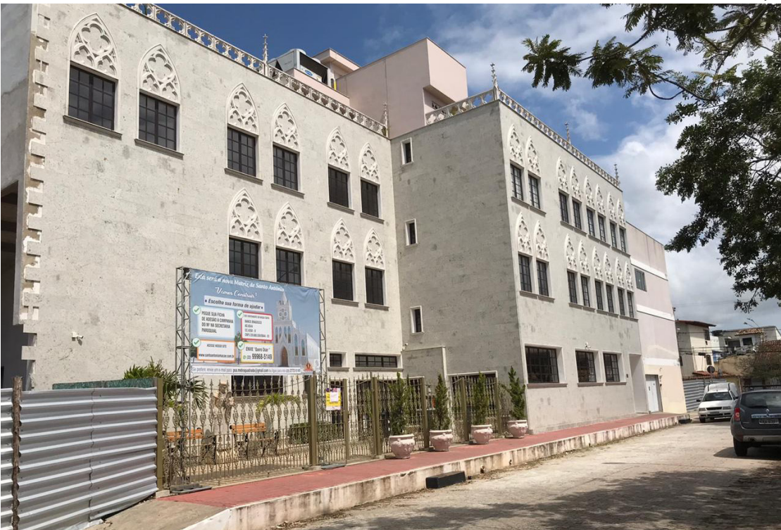
A Paróquia Santo Antônio preparou uma programação especial com transmissão ao vivo para o marcar o de São Cristóvão

Por isso, a programação iniciará com a Santa Missa às 09h, que será transmitida pelos canais oficiais da comunidade no