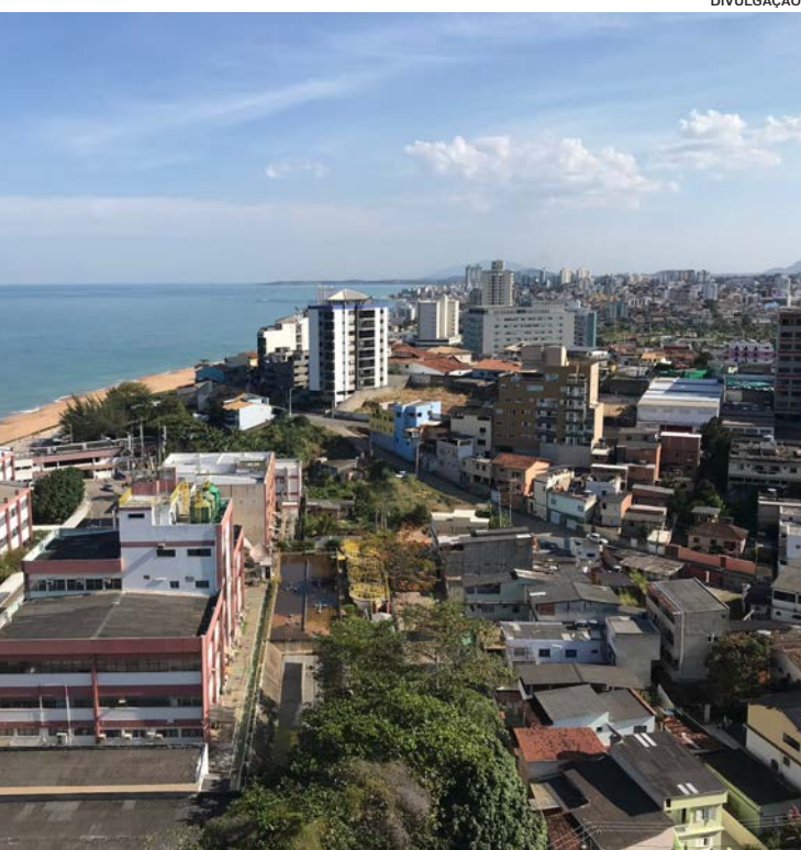
Amostragem irá abordar moradores dos quatro principais setores da cidade

A partir dos novos resultados, o jornal dará continuidade a abordagem do cenário pré-eleitoral do município, com o apoio do Escritório Erricheli Lopes & Machado.