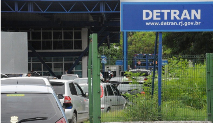
Falso site de leilões utiliza o nome do Detran-RJ para aplicar golpes em quem quer comprar carros e motos