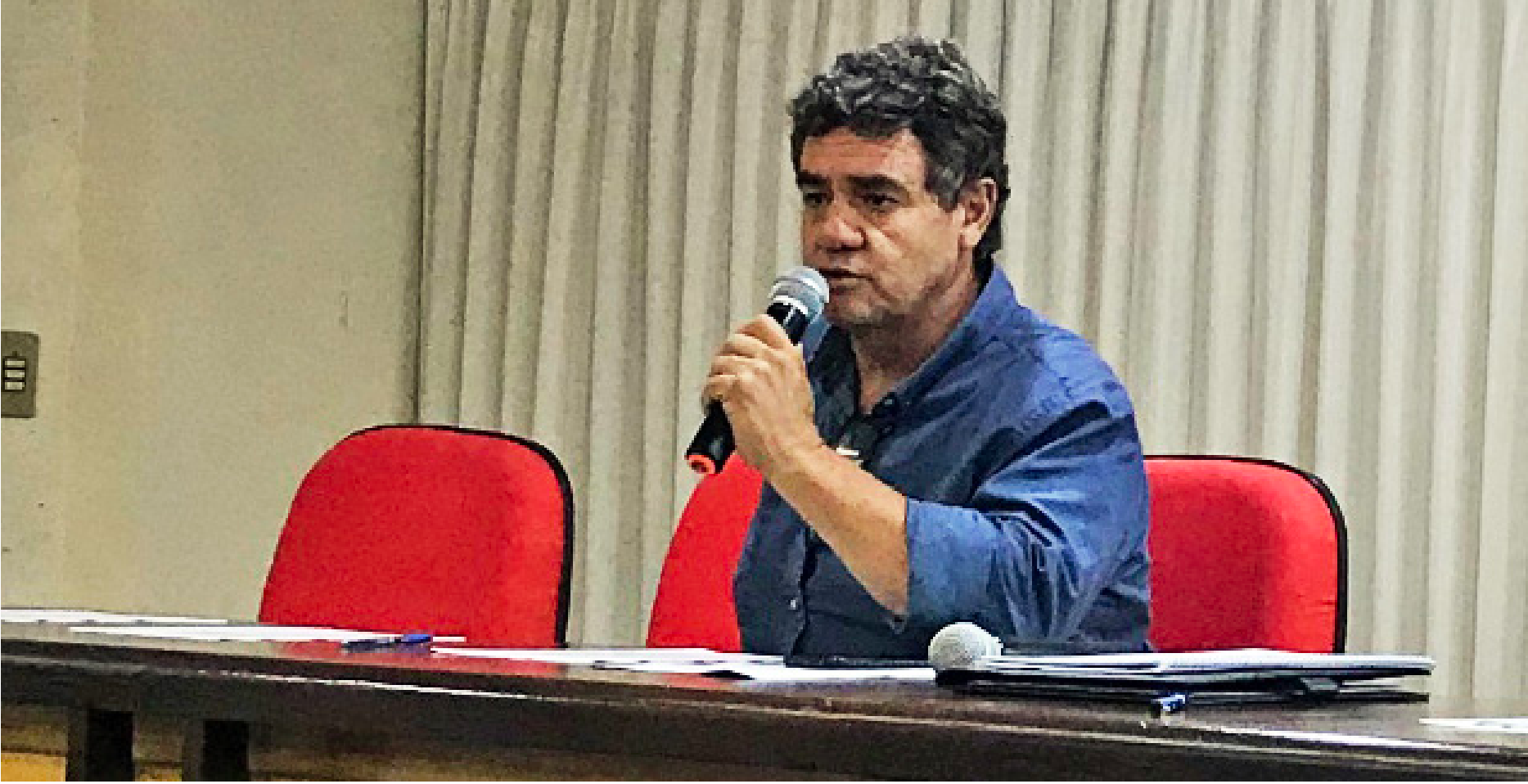
O Presidente Navela afirma que a condução das ações que pautam agora a sobrevivência da economia requer um olhar bem mais apurado que o da medicina

“Fomos os primeiros a adotar a máscara, o álcool em gel e o distanciamento social como o “novo normal”. Também fomos os primeiros a defender a testagem ampla, ao abraçar o proje-