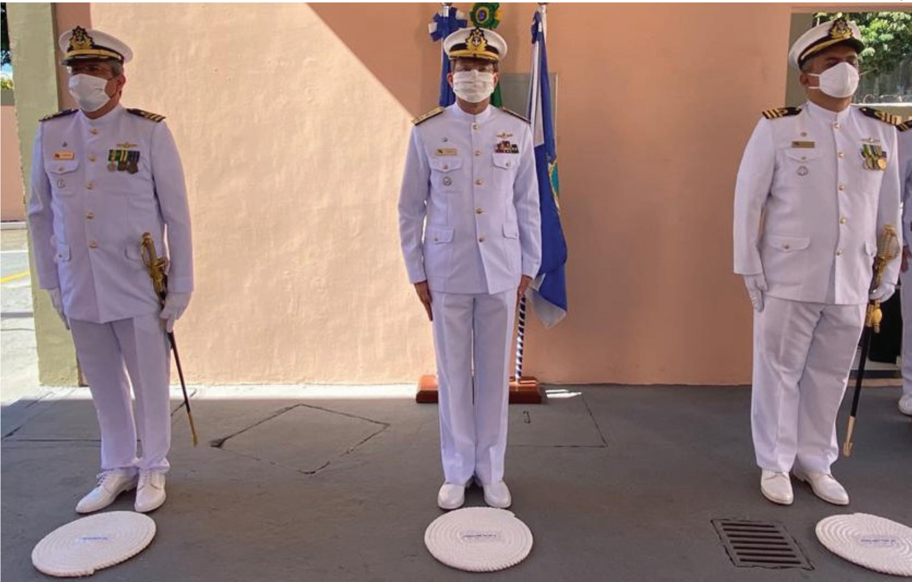
A Cerimônia de Transmissão de Cargo de Capitão dos Portos de Macaé aconteceu, na própria Capitania

Como Agente da Autoridade Marítima Brasileira em Macaé e nos demais 17 municípios de sua jurisdição, o novo Capitão dos Portos terá um mandato de dois anos, exercendo principalmente as seguintes atribuições: