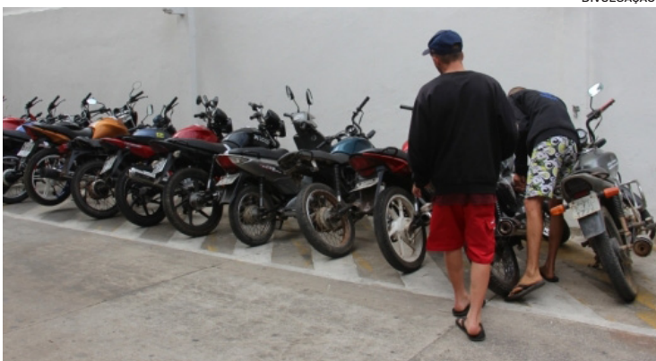
Segundo CTB, motociclistas flagrados conduzindo veículos com descarga livre podem responder por infrações e ser multado no valor de R$ 195,23, e perda de cinco pontos na CNH

A Guarda Civil Municipal de Rio das Ostras orienta motociclistas sobre poluição sonora