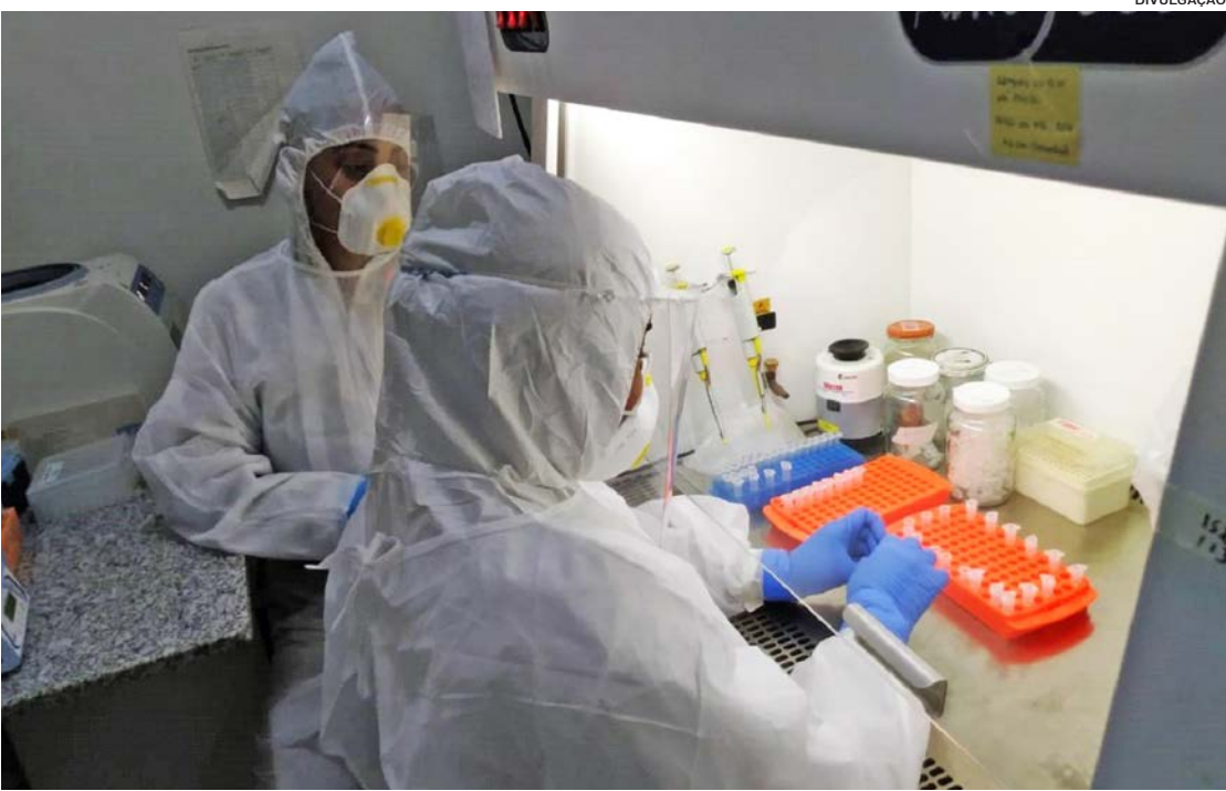
Laboratório do NUPEM/UFRJ tem a capacidade de realizar 120 exames por dia pelos próximos meses

INSTITUTO DE BIODIVERSIDADE e Sustentabilidade - NUPEM-UFRJ vem desenvolvendo trabalho de excelência para mitigar os efeitos da pandemia. Neste sentido, foi aprovado pelo Laboratório Central Noel Nutels o credenciamento do Instituto NUPEM para diagnosticar o SARS-COV-2 por RT-PCR em Macaé. PÁG. 7