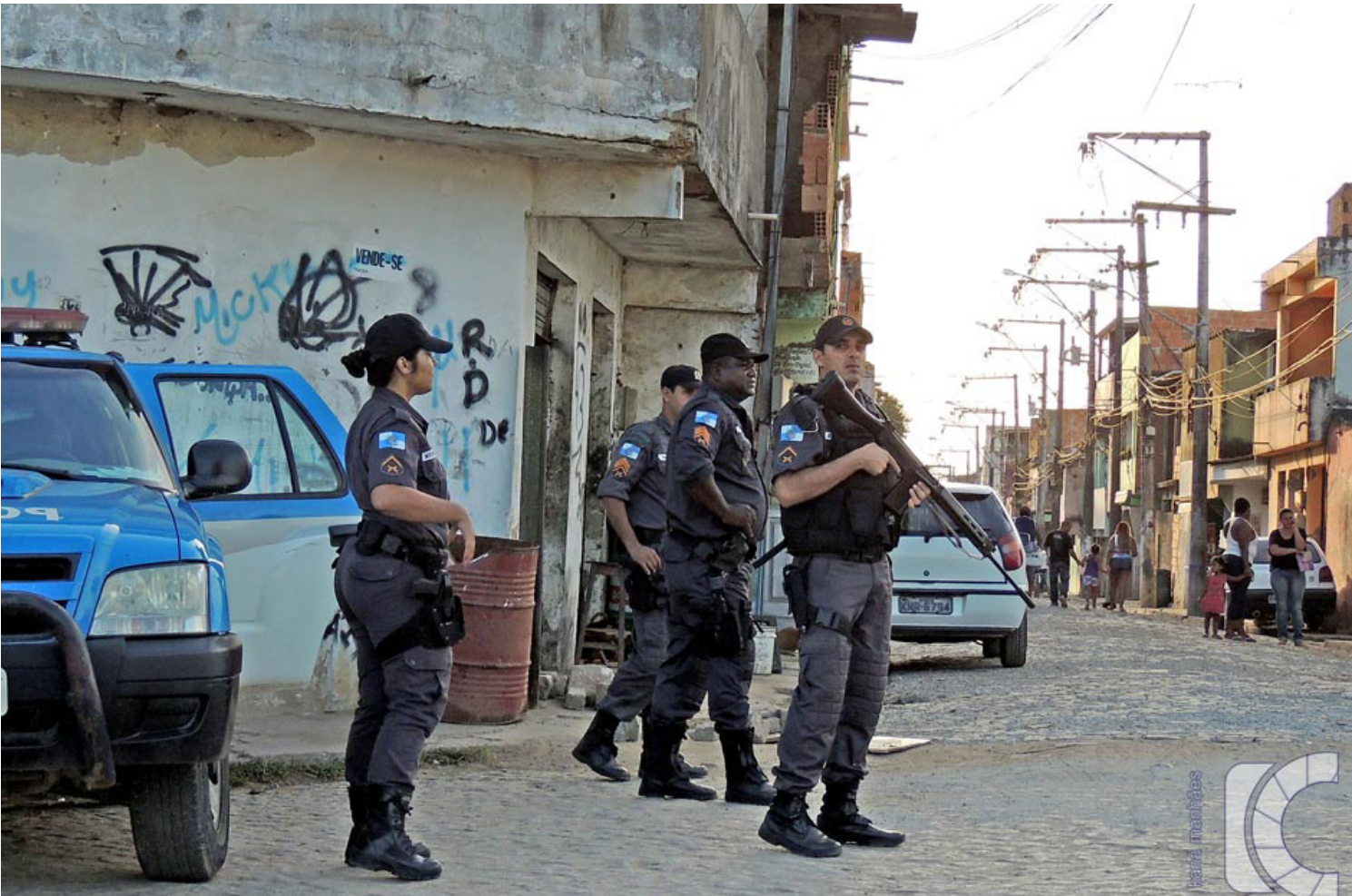
Em Macaé, assaltos crescem 108% nos primeiros quatro meses do ano em comparação ao mesmo período de 2019

Já o município de Rio das Ostras com 145 mil habitantes a situação é preocupante. A