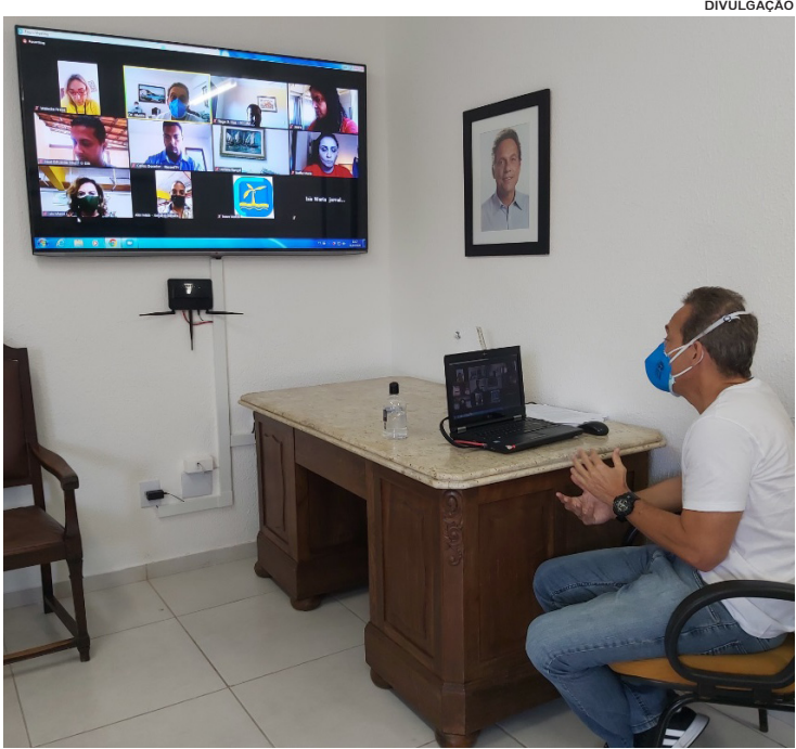
A entrevista coletiva aconteceu nesta sexta-feira (29) por videoconferência