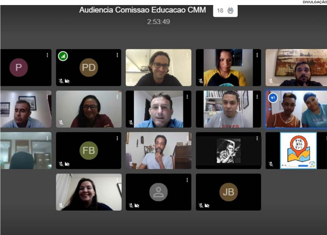
A Audiência debateu necessidades geradas pela paralisação das atividades culturais