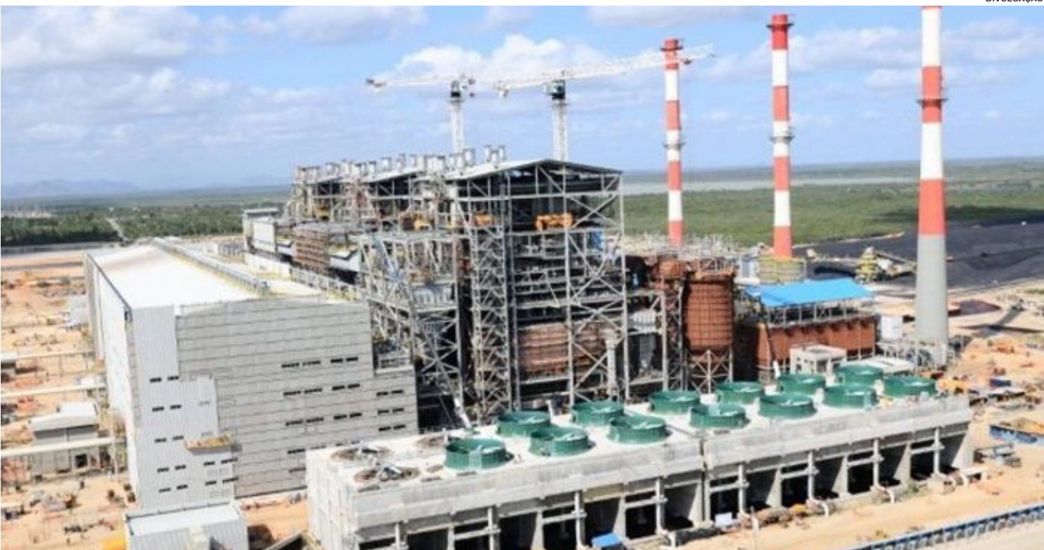
O projeto do novo empreendimento é avaliado em US$ 700 milhões

Depois de vencer o contrato em 2017, a Marlim Azul será a primeira usina termoelétrica a usar gás natural produzido