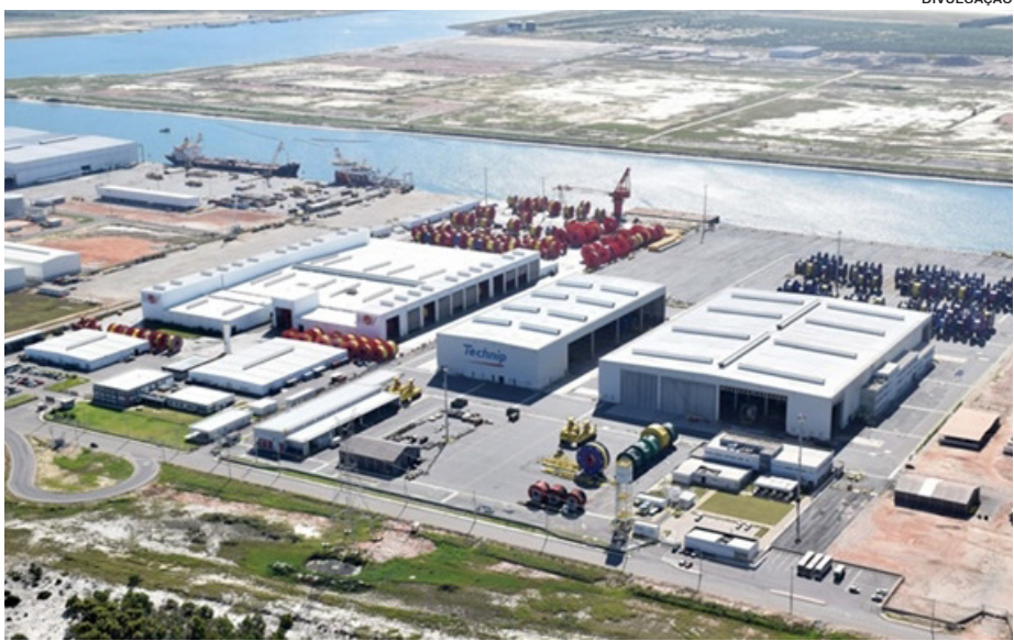
A companhia Oil Group realizou a assinatura de um acordo com o Porto do Açu para a construção de uma refinaria de pequeno porte