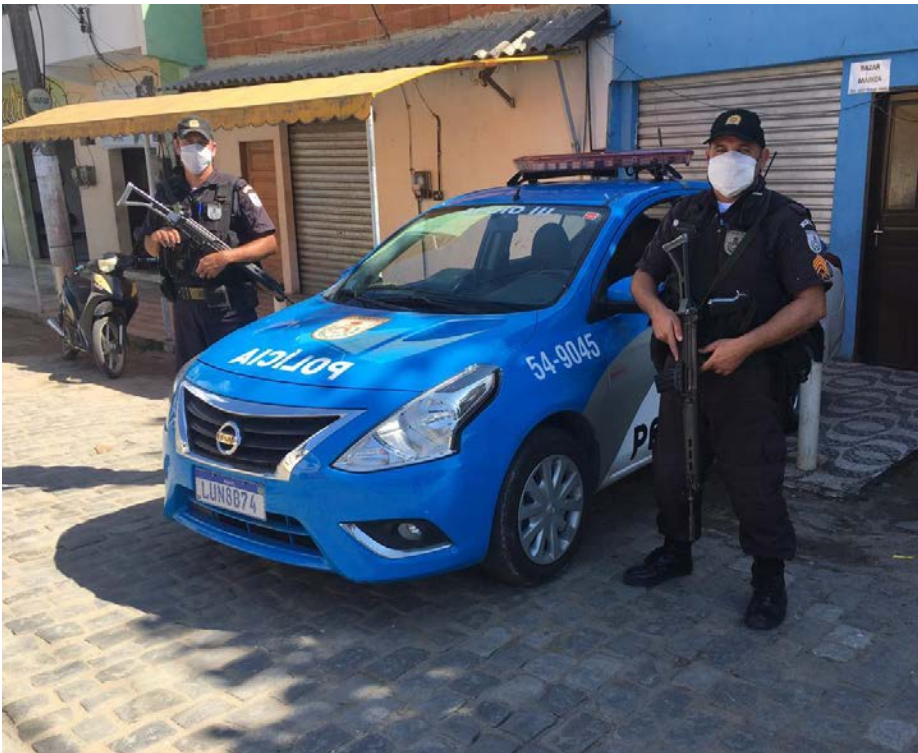
Polícia atua nas comunidades dominadas pelo tráfico para combater o tráfico e disputa pelo ponto de venda de drogas