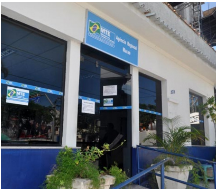
Com o Ministério do Trabalho fechado, trabalhadores encontram dificuldades em dá entrada no seguro-desemprego pelo telefone e internet

(MT) reconhece que existem pedidos represados e milhares de trabalhadores não conseguiram fazer a solicitação. Além da agência do MT de Macaé estar fechada, trabalhadores que perderam o emprego não estão conseguindo pedir o seguro pela internet. Por isso, os números podem ser bem maiores. Entre as queixas estão impossibilidade de concluir o pedido no site < https://www.gov.br/pt-br/servicos/solicitar-o-seguro-desemprego > e aplicativo "Carteira de Trabalho Digital" e de obter informações pela central 158.