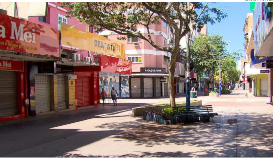
Além dos restaurantes da orla do Cavaleiros, comércios na área central também permanecem fechados

O cenário da Orla da Praia dos Cavaleiros, conhecida por sua variedade de restaurantes e bares, está atípico, ultimamente. Um dos locais mais movimentados da cidade está ermo. O Polo Gastronômico, que movimentava a economia