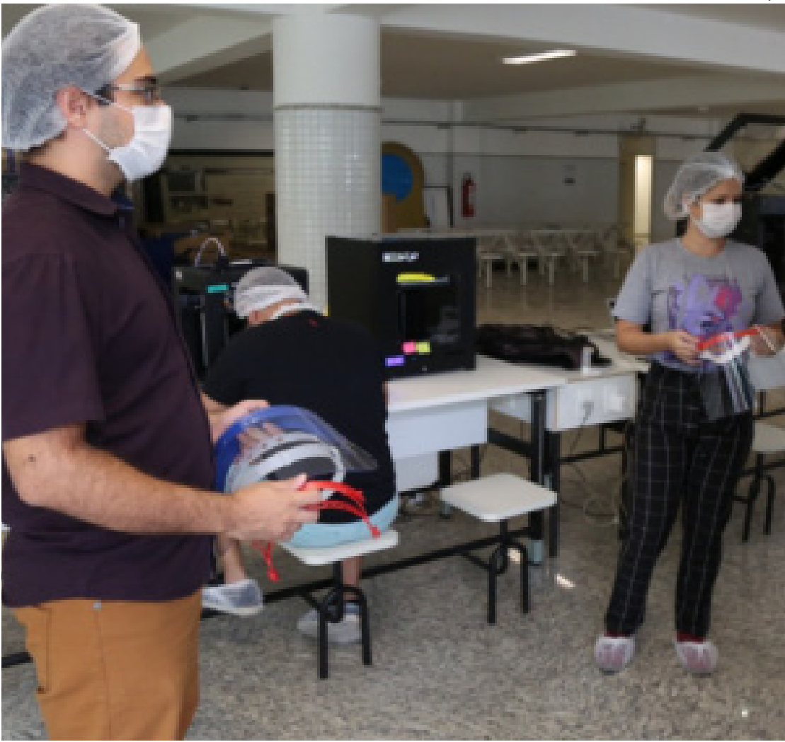
A estrutura está montada anexo ao Pronto Socorro

cal para triagem são as pessoas que apresentam somente sintomas como febre, tosse seca, dor de garganta e, principalmente, falta de ar. O Centro de Triagem do Centro de Saúde Extensão do Bosque está previsto para ser inaugurado até o fim deste mês. No entanto, se houver necessidade, a tenda do Pronto-Socorro poderá dar continuidade ao seu funcionamento, tornando-se assim mais uma linha de frente no combate ao Covid-19.