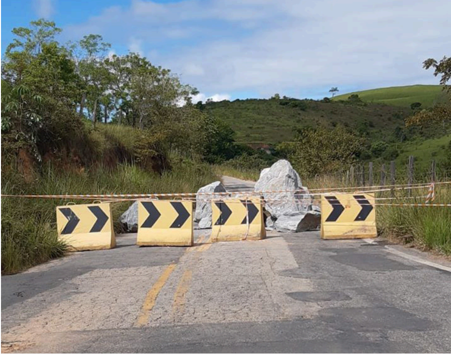
EU, LEITOR, O REPÓRTER

Acesso da BR-101 com a Estrada do Imbuuro foi interditada por pedras e faixas impedindo fluxo de trânsito de motoristas