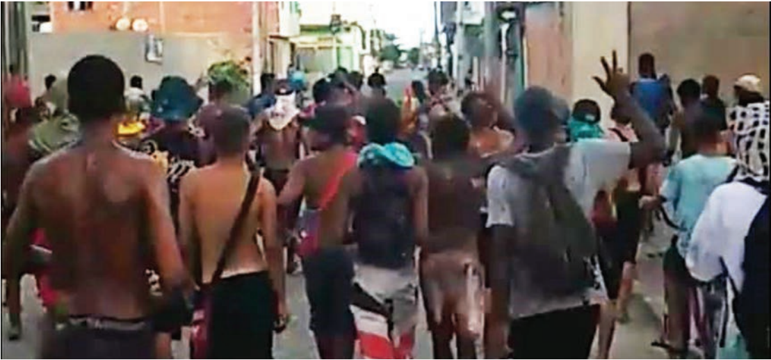
EU, LEITOR, O REPORTER

O conteúdo dos sacolés, ao contrário dos tradicionais sucos de fruta, não é nada saboroso. Os participantes costumam entrar na ‘batalha’ usando água de esgoto, tinta, urina e até fezes. A prática, que despertou a simpatia de uns e o horror de outros, não é nova e há registros de outras ‘guerras’.