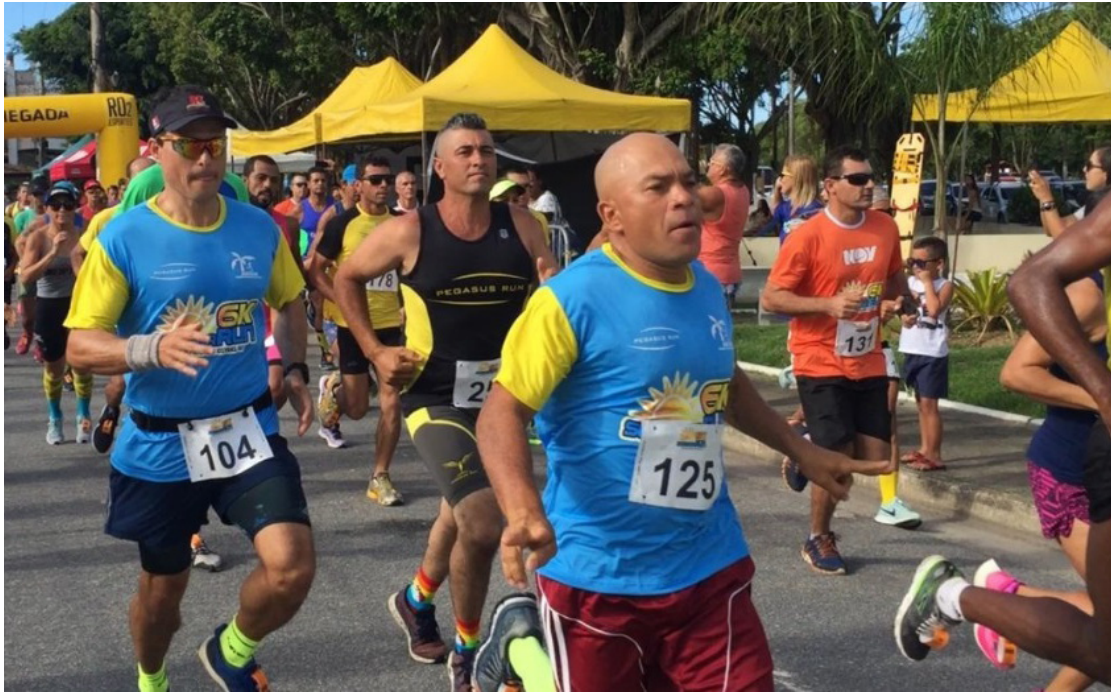
Os cinco primeiros lugares do masculino e feminino foram premiados com troféus e medalhas

Prova foi promovida pela Ascom Macaé junto com a Podium Simulados. Corrida aconteceu no último dia 9