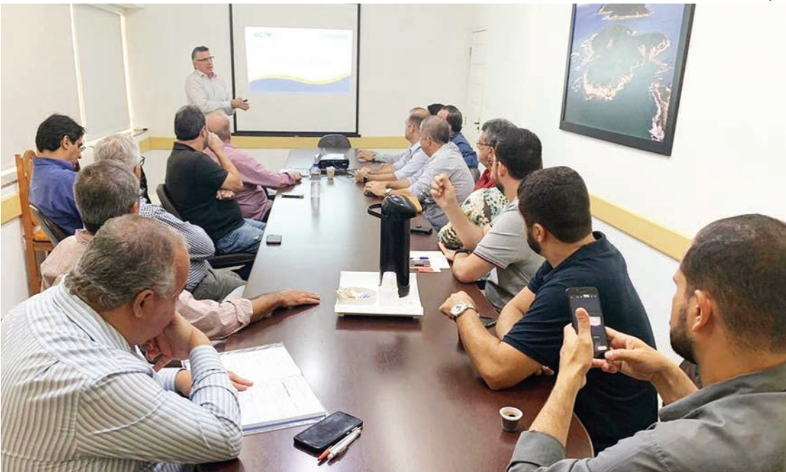
Reunião na ACIM avalia dados apresentados pela Abespetro

Nesta semana, duas reuniões promovidas pela Associação Comercial e Industrial de