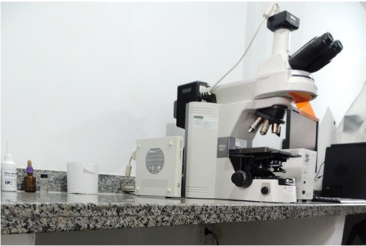
Novos equipamentos evitam danos aos aparelhos dos laboratórios causados pela alta umidade da região

CONSIDERADA UMA DAS instituições mais importantes da Estado do Rio, o Instituto de Biodiversidade e Sustentabilidade Nupem/UFRJ vem se modernizando. Recentemente, a Direção realizou a compra de equipamentos de desumidificação que proporcionam menores custos com a manutenção e troca de peças em microscópios utilizados em pesquisas. A Unidade Integrada de Imagem (Equipamentos de Microscopia Óptica) e a Unidade Integrada de Microscopia Eletrônica (Microscópio Eletrônico de Varredura) funcionam como unidades multiusuário, permitindo o acesso de alunos, professores e técnicos administrativos de todos os laboratórios do Instituto a equipamentos de altíssima qualidade e fundamentais na produção científica. O microscópio eletrônico de varredura (EVO MA10) da instituição é o único deste tipo na região Norte Fluminense. Esse equipamento possui aplicações na área automotiva, limpeza de