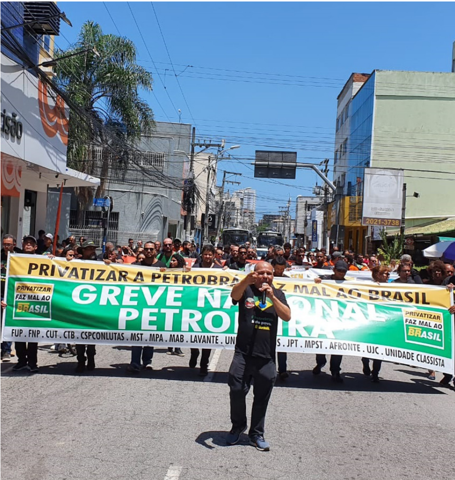
Trabalhadores percorreram ruas e avenidas no Centro de Macaé e distribuíram panfletos e jornais de denúncia contra a estatal

P etroleiros em Greve realizaram uma caminhada, na tarde de sexta-feira (14), por volta das 12h30, na base de Imbetiba, em direção à Praça Veríssimo de Melo, em Macaé. Cerca de 100 trabalhadores se concentraram no portão da estatal, junto a diretores do Sindicato dos Petroleiros Norte Fluminense (Sindipetro - NF). A categoria petroleira está em greve desde 1º de fevereiro. No Norte Fluminense, o movimento conta, até o momento, com a adesão de 35 plataformas e de bases de terra de Macaé. Os trabalhadores protestam contra as demissões de cerca de mil trabalhadores, contra o desmonte da companhia e contra a política de preços dos combustíveis que penaliza a população brasileira. O Sindipetro-NF fez um chamado à unidade da categoria, para que as plataformas que restam sem fazer a adesão entrem para a greve. Na Bacia de Campos, apenas quatro unidades (PRA-1,