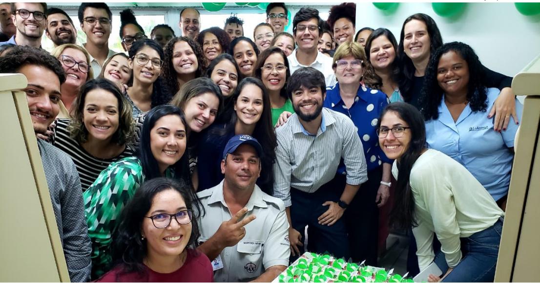
Defensores, Servidores, estagiários e colaboradores da instituição participaram de confraternização simbólica pelo aniversário de 1 ano na nova sede

Atendimento foi unificado e passou a ser oferecido em um único endereço, na Virgem Santa, no antigo prédio de O Debate. Objetivo é melhor atender a população com maior conforto e qualidade