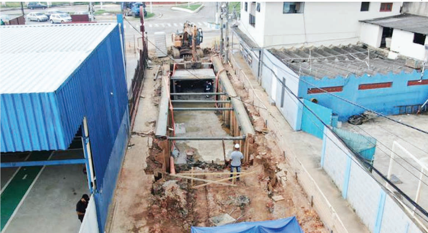
Intervenções são realizadas em um dos pontos mais complexos da cidade

sidade nesta época do ano. O projeto visa aumentar a capacidade de captação de águas das chuvas com a ampliação do canal da Avenida Fábio Franco (Linha Vermelha) e construção de outros canais auxiliares nas Ruas Jonas Mussi e Cristal, no Sol Y Mar. As intervenções começaram pelo canal auxiliar na Rua Jonas Mussi. São 550 metros de extensão por 3,60 x 1,90 metros de largura e profundidade. A primeira etapa da obra contempla ainda a construção do segundo canal auxiliar na Rua Cristal com 450 metros de extensão por 3,80 x 2,0 metros de largura e profundidade. Os dois canais seguirão até a Rua Humberto Queiroz Matoso. PÁG. 3