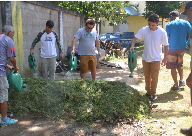
Segundo o Nupem, o intuito é mostrar uma alternativa mais sustentável no cultivo de alimentos com menor impacto ambiental e econômico

O treinamento continuará a ser oferecido em outras oportunidades e faz parte das iniciativas de projetos de extensão do NUPEM/UFRJ que fornecem apoio técnico-científico a escolas e comunidades da região.