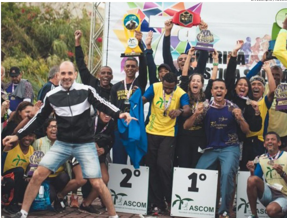
Os interessados em participar têm até o próximo dia 31 para se inscrever.