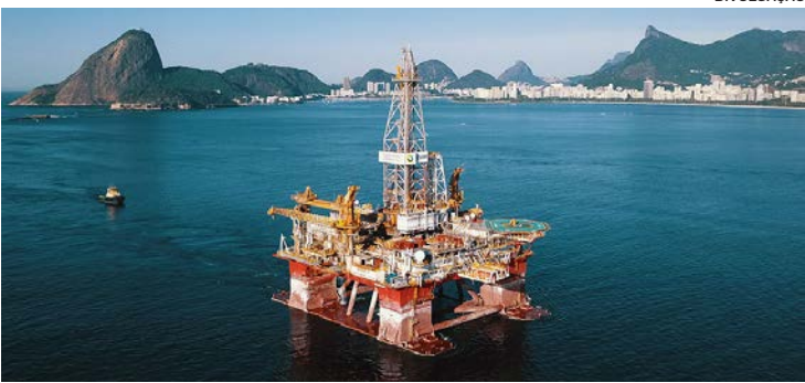
A sonda semissubmersível da Ocyan realizará atividades de intervenção em poços da Petrobras na Bacia de Campos, no pré-sal brasileiro

ao desafio em questão. O tema do desafio foi estabelecido pela empresa juntamente com a Junior Achievement. O Innovation Camp é um programa da Junior Achievement (JA), que está inserido no pilar de empreendedorismo. Em parceria com a organização, a Baker Hughes desenvolveu o Innovation Camp em setembro do ano passado, com foco em estudantes da rede pública de Macaé e Niterói, cidades em que a empresa concentra maior parte das suas operações. Foram quatro meses de preparação para o Innovation Camp, que teve duração de oito horas e participação de dois jurados externos de empresas do setor de petróleo e gás.