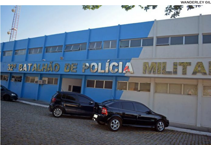
32º BPM de Macaé apresenta redução na criminalidade

Casimiro de Abreu, Conceição de Macabu e Quissamã. O trabalho realizado de maneira integrada com a Polícia Civil, Polícia Federal, Guarda Municipal, Mobilidade Urbana, Exército Brasileiro, Marinha do Brasil e a sociedade, foi fundamental para o aumento do número de autos de prisão em flagrante em 25,7% (maior variação dentre todas as AISP do estado) e de 14,4% das Apreensões por tráfico de drogas (4ª maior variação dentre todas as AISP do estado). Foram apreendidas 289 armas. No balanço geral, a Aisp 32 ficou em 2º Lugar no Estado no alcance das metas.