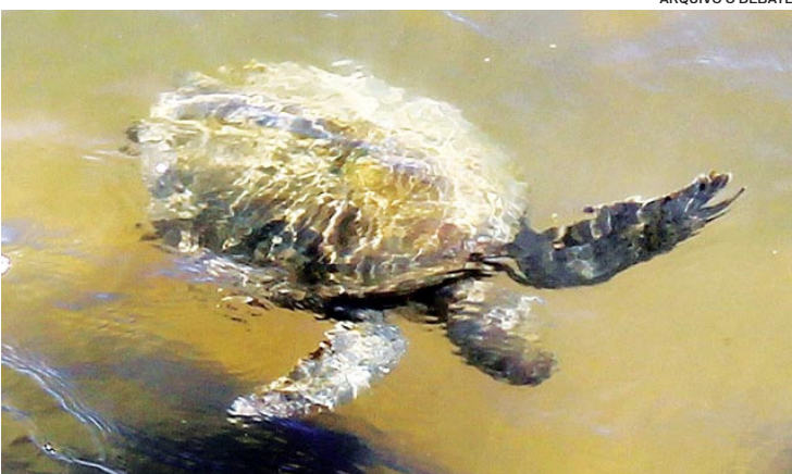
Entre as espécies ameaçadas que podemos encontrar em Macaé, três delas são de tartarugas marinhas

“Na cidade de Macaé e região ainda encontram-se espécies silvestres ameaçadas de extinção, que já não ocorrem am-