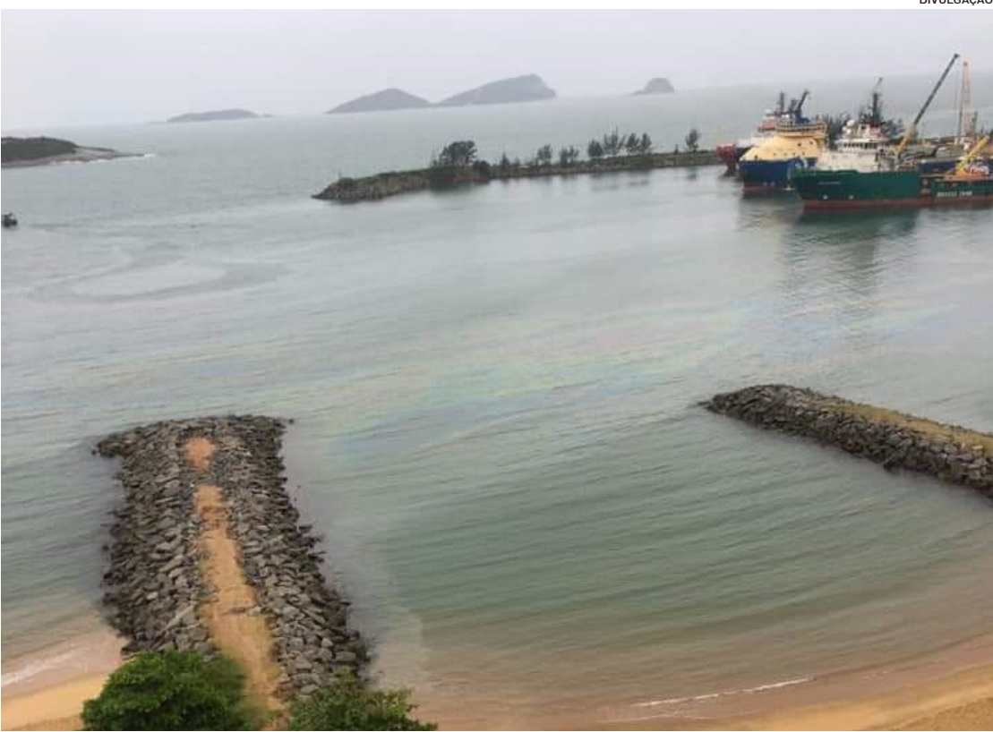
Derramamento de óleo na Praia de Imbetiba foi registrado fim da tarde da última quinta-feira (23). Especialista orienta banhista para não entrar no mar