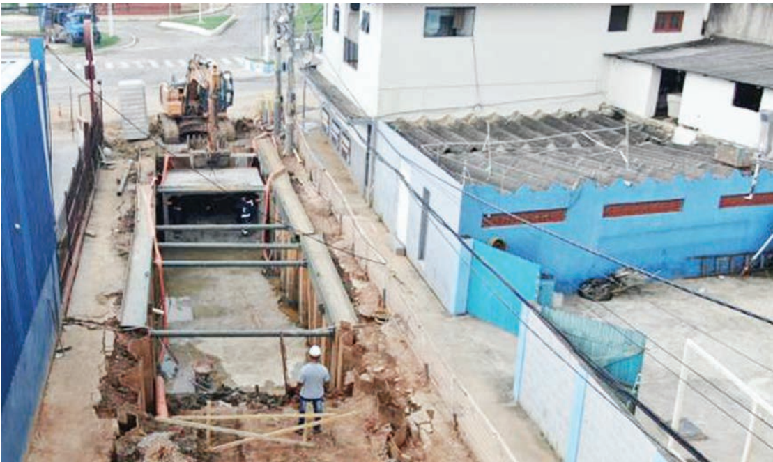
Intervenções são realizadas em um dos pontos mais complexos da cidade

As intervenções começaram pelo canal auxiliar na Rua Jonas Mussi. São 550 metros de extensão por 3,60 x 1,90 metros de largura e profundidade. A primeira etapa da obra con-