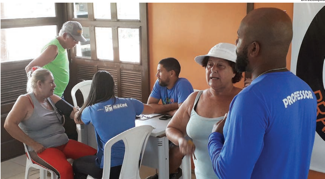
Os idosos recebem aulas de ginástica, com alongamento, yoga e pilates