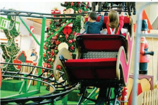
Até a véspera de Natal ainda é possível tirar foto com o bom velhinho

Até o dia 23 de dezembro, todas as lojas ficarão abertas até às 23 horas PÁG. 6