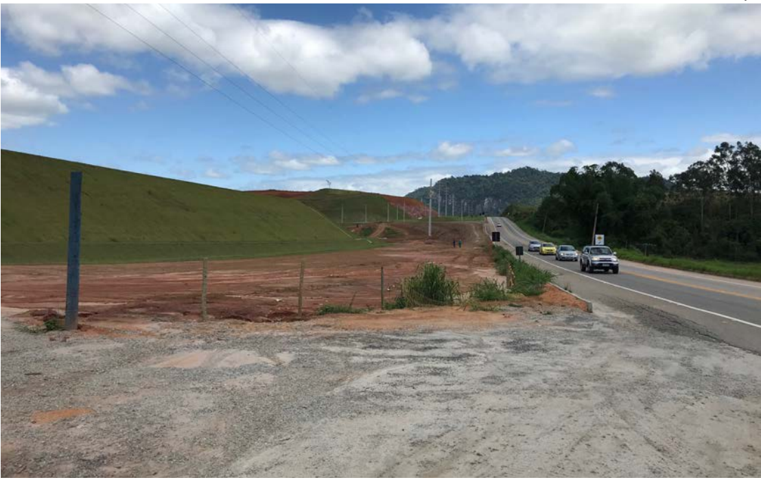
Termelétrica está sendo construída em área do CLIMA, à margem da RJ 168

O dinheiro já foi garantido ao consórcio firmado pelo Grupo Pátria, pela Shell Gas e pela Mitsubishi Hitachi Power Systems