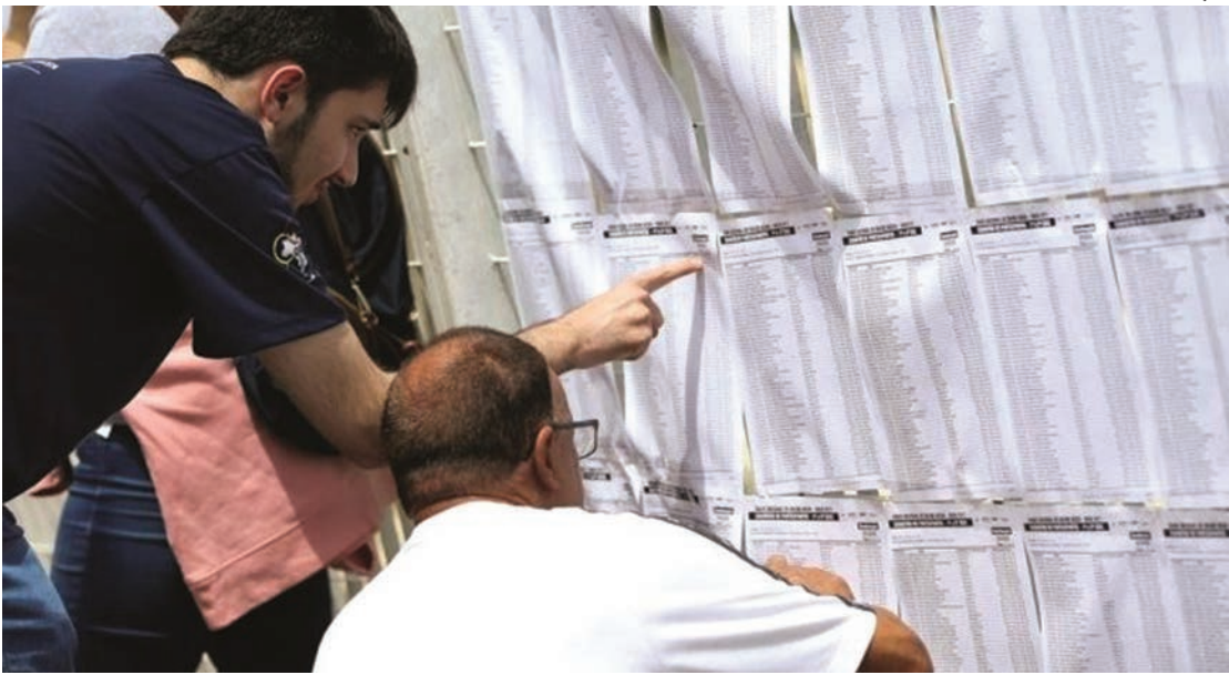
Estudantes devem chegar com uma hora de antecedência ao local de prova

Estudantes de todo o país farão a prova de ciências da natureza e matemática. Portões fecham às 13h (horário de Brasília)