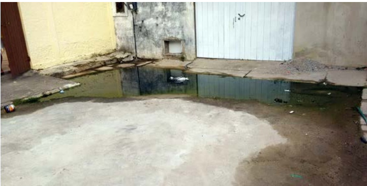
Moradores reclamam do mau cheiro e dos riscos a saúde por conta de esgoto a Céu aberto na rua

APESAR DE O saneamento básico ser uma das maiores obras do governo atual, o problema de esgoto a céu aberto é algo que ocorre em toda a cidade, principalmente nas áreas periféricas e carentes de infraestrutura. Sem receber manutenção na rede há um bom tempo, o resultado não poderia ser outro a não ser um grande vazamento de esgoto. Isso tem ocorrido na Rua Hildo Ramalho (antiga Rua 81), no Parque Aeroporto. Preocupados com os problemas que isso pode acarretar, essa semana, moradores procuraram o jornal O DEBATE em busca de ajuda. Nas imagens enviadas à nossa redação, é possível ver que o esgoto toma conta de boa parte da rua. Quem mora em frente é o mais prejudicado. A população reclama do mau cheiro e dos riscos a saúde que isso pode causar. Segundo os moradores, as au-