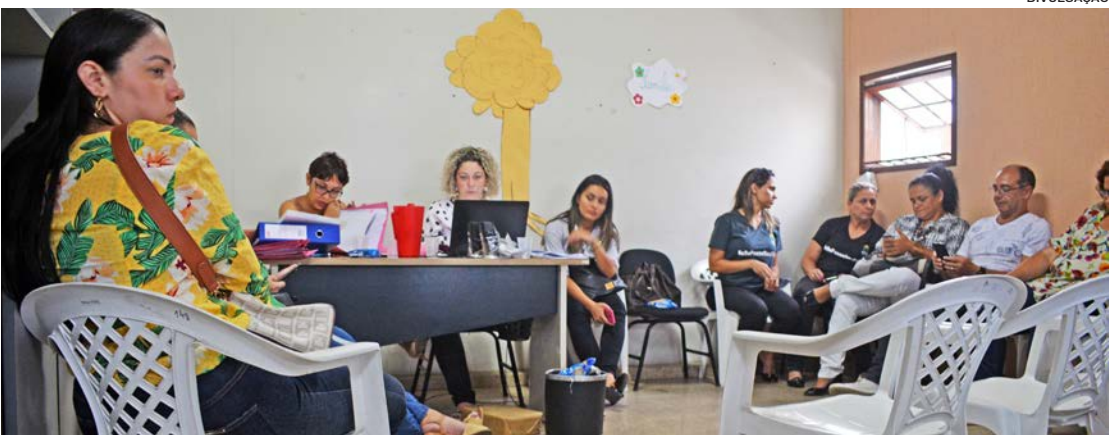
Sessão plenária teve início às 9h e se estendeu até o fim da tarde de quinta-feira (7)

Os nomes das candidatas impugnadas serão publicados esta semana no Diário Oficial. Durante a sessão plenária, foram constatadas práticas vedadas aos candidatos no de-