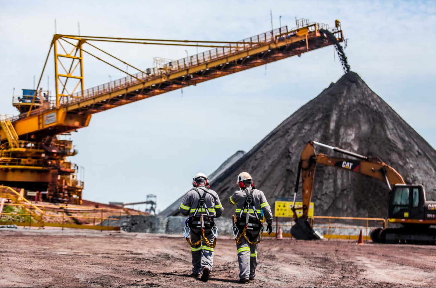
Terminal Multicargas do Porto do Açu completou 3,6 milhões de horas trabalhadas sem acidentes com afastamento