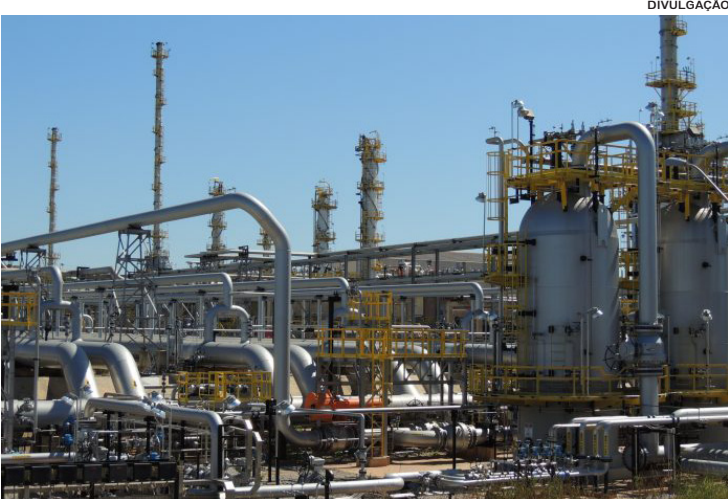
O município se prepara para atender as demandas da Petrobras, da Shell e da ExxMobile, empresas gigantes da cadeia de óleo e gás

Um passo à frente nas transformações que o mercado offshore brasileiro encara nos últimos anos, Macaé se consolida como a verdadeira “Cidade do Gás e da Energia”, ao financiar projetos e viabilizar experimentos que prometem alavancar a base da economia regional e estadual. Através de mais um passo importante na consolidação do Terminal Portuário (Tepor), após a publicação da licença prévia aprovada pelo Conselho Estadual de Controle Ambiental (CECA) do Instituto Estadual do Ambiente (INEA), o município se prepara para atender as demandas da Petrobras, da Shell e da ExxMobile, empresas gigantes da cadeia de óleo e gás global, que miram investimentos no desenvolvimento de novas áreas de produção de petróleo, arrematadas nos últimos leilões realizados pela Agência Nacional do Petróleo (ANP). Com investimentos avaliados em mais de US$ 10 bilhões, a Petrobras já antecipa projetos que visam aumentar a sua capacidade operacional na região que re-